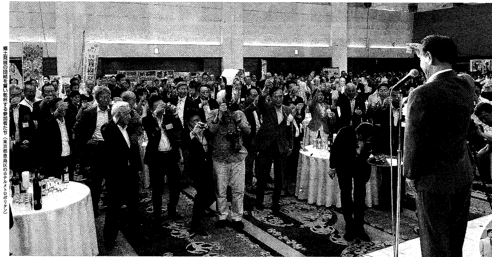
郷土発展の団結を誓い乾杯する参加者たち（東京都豊島区のホテルメトロポリタン）

創立100周年を迎えた埼玉県人会（大塚陸毅会長）JR東日本相談役の節目を祝う「埼玉応援団大集合!! I LOVE SAITAMA FROM TOKYO 2013」が8月28日、東京都豊島区のホテルメトロポリタンで開催され、政治、経済、行政、文化など各界の本県関係者約600人が一堂に会し、県経済の活性化と県民生活の向上を目指すとともに、わが郷土・埼玉の躍進を誓い合った。今年、大偉人の渋沢栄一翁が初代会長として県人会を発足してからちょうど100年目に当たる記念すべき年。式典会場では、埼玉県の潜在力を前に向きにとらえた明るい話題の花があちこちで「開花」した。県人会の新たな船出を祝うとともに強固な団結で心を一つにした式典の様子を写真で紹介する。