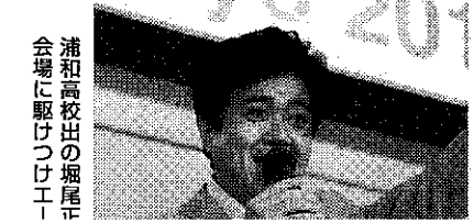
浦和高校出の堀屋正会場に駆けつけエ