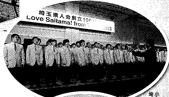
小松原高校音楽部が埼玉県歌を披露